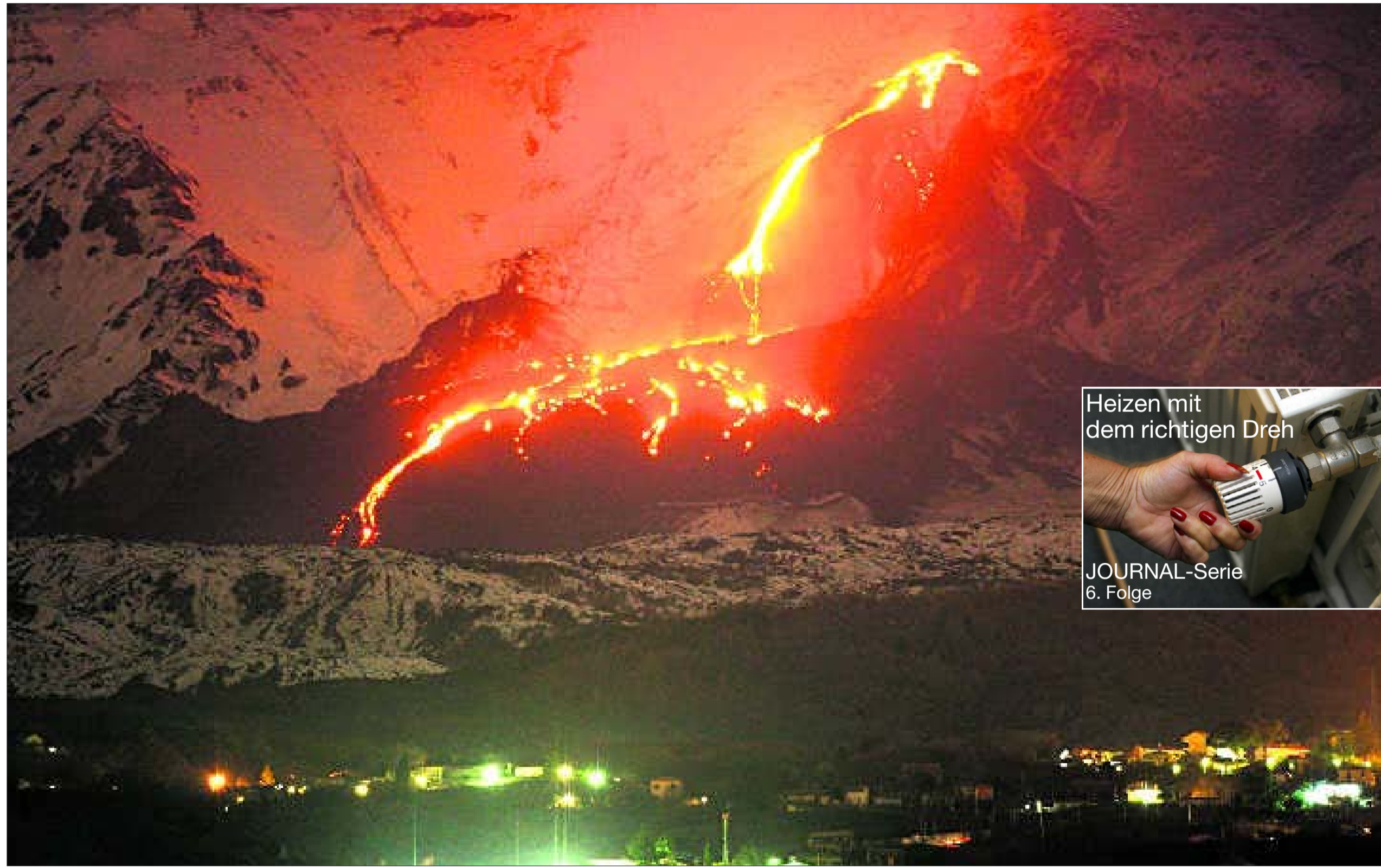
Ein Lava-Ausbruch des Ätna auf Sizilien macht deutlich, welche Hitze und wie viel Energie im Erdinneren vorhanden sind.